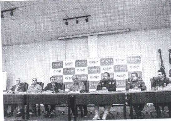
Titulares das forças de segurança no Ceará ressaltam que denúncias devem ser encaminhadas imediatamente para os órgãos de segurança

Acres de facções criminosas também estão na mira do plano de atuação da SSPDS-CE no período eleitoral. De acordo com a pasta de segurança, grupos criminosos têm realizado ações criminosas contra campanhas eleitorais no Ceará. O titular da Polícia Civil do Estado