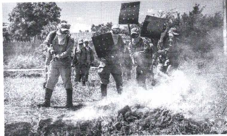
De janeiro a outubro o Ceará tem registro de 1.226 focos

Em 2024 o número de focos de fogo ultrapassa a marca de 1.200; Sobral e Icó são algumas das cidades mais vulneráveis