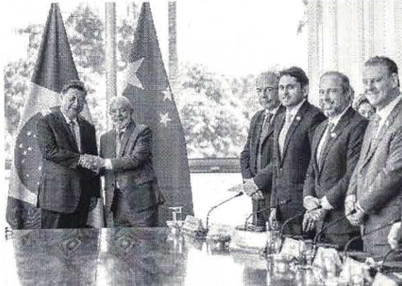
No total, 37 acordos foram formalizados durante a visita oficial do presidente chinês, Xi Jinping, a Brasília

Entre os compromissos estão investimentos em projetos para ambos os países, transferência tecnológica e capacitação de recursos humanos