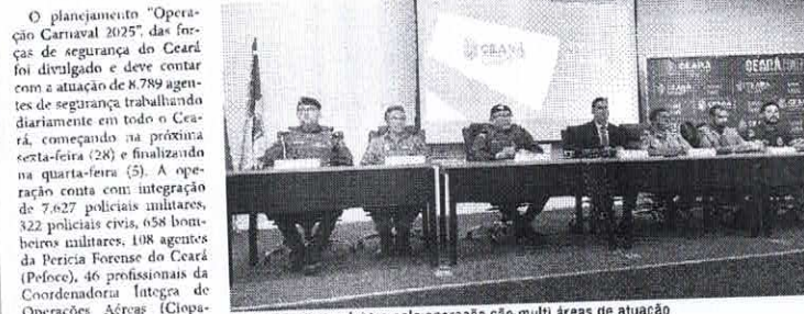
As ações desenvolvidas pela operação são multi áreas de atuação

Com mais de 8 mil agentes atuando diariamente, plano tem novidades com atuação integral de delegacia especializada em ações de grupos criminosos