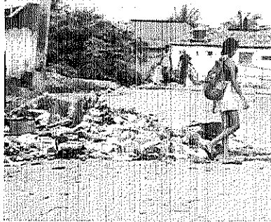
A Prefeitura de Caucaia destacou que, durante o Carnaval 2018, a coleta de lixo será reforçada em pontos de maior movimentação.

A Prefeitura de Caucaia destaca, por meio de nota, que du-