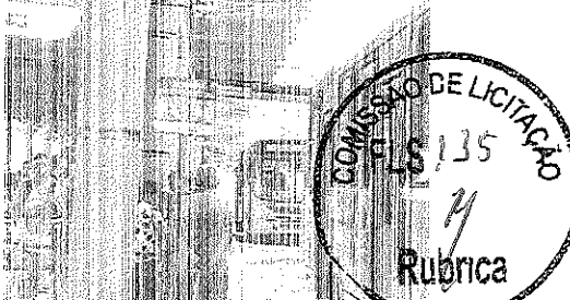
Decreto sobre reajuste das passagens foi publicado pela Prefeitura de Fortaleza no último dia 27, no Diário Oficial do Município (DOM)