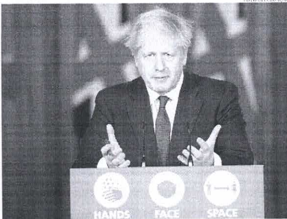
Boris Johnson, primeiro-ministro britânico, impôs um novo lockdown este fim de semana

A Itália, a Holanda e a Bélgica suspenderam neste domingo (20) as viagens oriundas do Reino Unido após o governo britânico endurecer o lockdown com medo de uma mutação do novo coronavírus. Enquanto isso, a Alemanha e a França estão adotando medida semelhante, segundo a agência de notícias RTT. A Espanha pede que os países tomem ações coordenadas sobre o assunto. As suspensões foram anunciadas no dia seguinte ao que o primeiro-ministro britânico, Boris Johnson, endureceu as restrições ao contato social em Londres e partes do sudeste da Inglaterra até 30 de dezembro, citando como razão para isso o espalhamento de uma nova variação do vírus. A Organização Mundial da Saúde (OMS) pediu aos seus membros europeus que fortaleçam suas ações de controle contra a pandemia. Fora do território britânico, alguns casos foram notificados na Dinamarca, na Holanda e na Austrália, segundo a entidade.